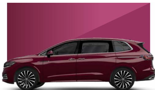
Đỏ Crimson - Metallic