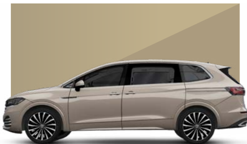
Vàng Brisbane - Metallic