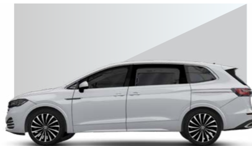
Trắng Glacier - Pearl effect