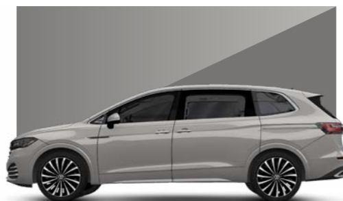
Bạc Leaf - Metallic